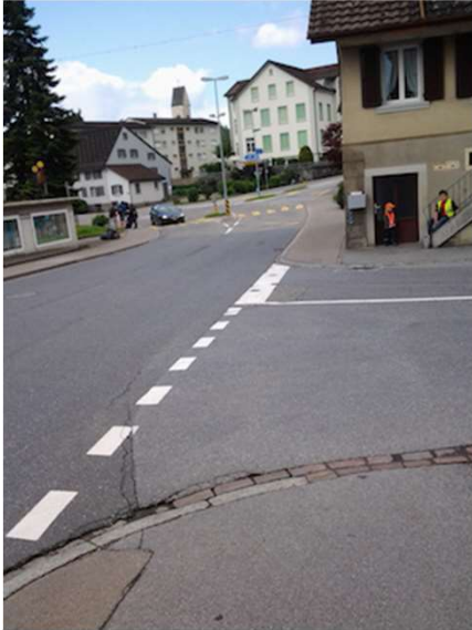
Komplexer Knoten Ricken- / Bürgstrasse in Eschenbach