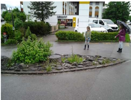
Im Winter hat es einen grossen Schneehaufen