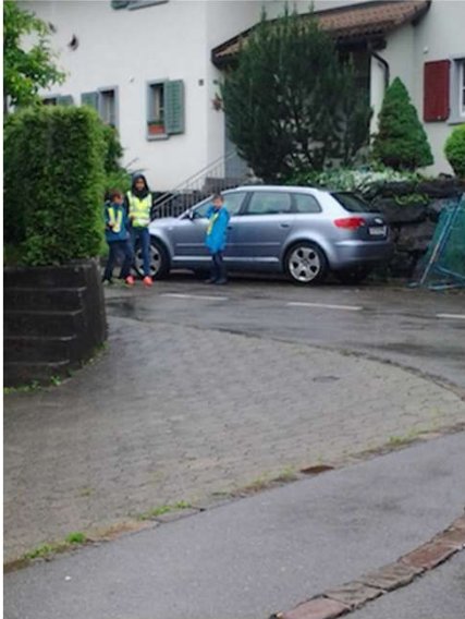
Übersicht in Quartierstrasse