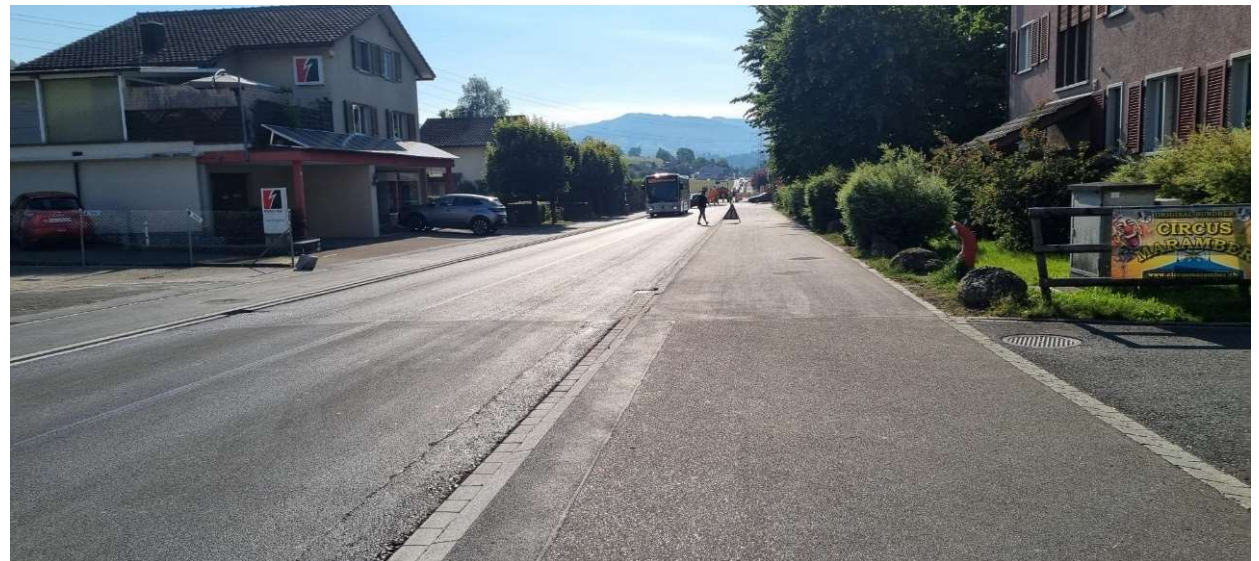
Rickenstrasse Eschenbach Erweiterung Geh und Radweg auf 3.5m